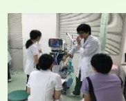
呼吸管理シミュレーション